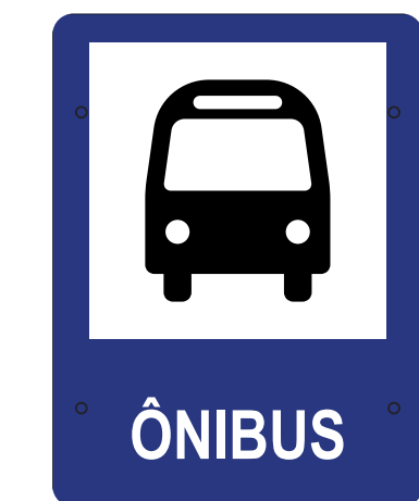
VISTA FRONTAL ESC.: 1:10