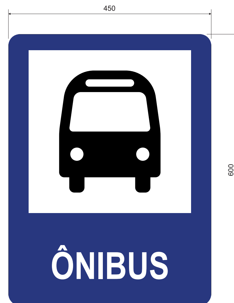
LAYOUT DA PLACA ESC.: 1:5